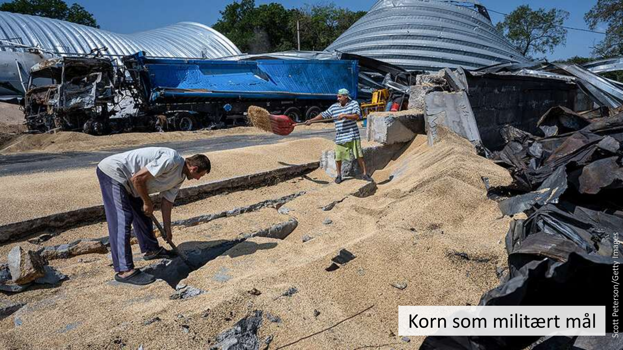
Korn som militært mål